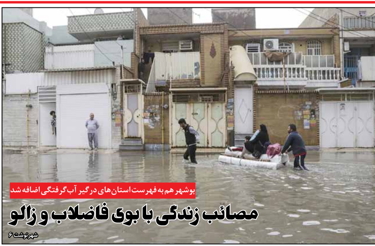
بوشهر هم به فهرست استان های درگیر آب گرفتگی اضافه شد