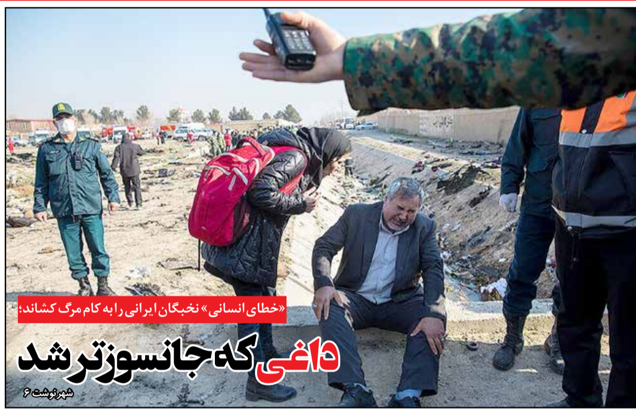
«خطای انسانی»، نخبگان ایرانی را به کام مرگ کشاند؛