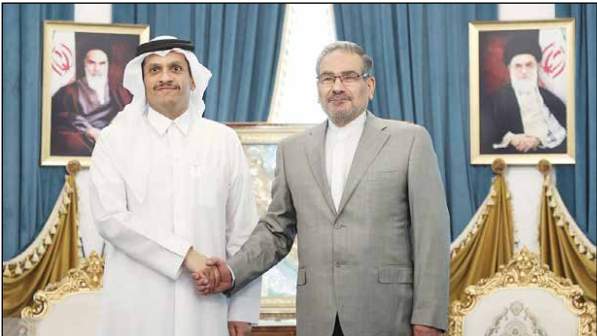
حسام الدین اسلامی

رئیس جمهوری و وزیر امور خارجه دربارۀ وضعیت مذاکرات احیای توافق تهران و ریاض گفتند و در حاشیۀ دیدارهای خود با رهبران دینی و دولتی ایران گفتند که در جریان مذاکرات، طرف ایرانی با توجه به اهمیت موضوع، آمادۀ ارائه پیشنهادهای جدید است. در این دیدار، طرف ایرانی به رهبران دینی و دولتی ایران گفت که در جریان مذاکرات، طرف ایرانی با توجه به اهمیت موضوع، آمادۀ ارائه پیشنهادهای جدید است.