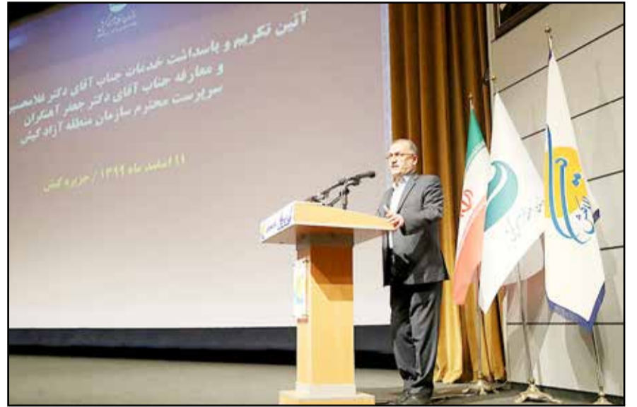
آیین تکریم و پاسداشت خدمات جناب آقای دکتر غلامحسین مظفری و معارفه جناب آقای دکتر جعفر آهنگران

فعالان اقتصادی، بخش خصوصی و مردم در شرایط کرونا ستاد همه جانبه مقابله و پیشگیری از شیوع ویروس تشکیل و با توجه ویژه به تاب آوری جزیره تصمیماتی مجزا از سرزمین اصلی اتخاذ شد که نتیجه آن استمرار کسب و کارها و رونق اقتصادی کیش بود. وی گفت: با همکاری شورای تامین، ائمه جمعه، شورای اداری، همکاران سازمان، مردم و نهادهای جزیره، اکنون در شرایطی هستیم که با مراقبت‌های جدی و کنترل بیماری در کیش، موارد بستری در جزیره نداریم که اگر این مدیریت بحران نبود فرو پاشی اقتصاد را در کیش اتفاق شاهد بودیم؛ تمامی این همدلی‌ها و تلاش‌ها در فضای مثال زدنی و جمع دوست داشتنی جزیره کیش اتفاق افتاد من نیز عضو کوچکی از این جمع بودم. مظفری با بیان این که در آغاز کار خود پایانه فرودگاه جزیره کیش را با ۴۴ درصد پیشرفت تحویل گرفتیم که اکنون با بیش از ۹۰ درصد در حال تکمیل است بر ضرورت تکمیل زیرساخت‌های گردشگری تاکید کرد و توسعه گردشگری حلال در منطقه در دو سال اخیر را از دیگر دستاوردها سازمان منطقه آزاد کیش برشمرد. مظفری همچنین از امضاء قرارداد ساخت مسکن ملی با وزارت راه در جزیره کیش خبر داد و افزود: ما اعتقاد داریم یا کاری در کیش نباید انجام شود یا کیفیت تمام و کارشناسی اساسی، به همین دلیل طرح‌هایی همچون باغ ایرانیان، بیمه تکمیلی و مسکن بومیان کیش، از جمله طرح‌هایی است که با تلاش شبانه روزی همکاران ما به ثمر نشسته و باید در استمرار و ادامه آنها بکوشیم و هر روز طرحی نو برای ارائه