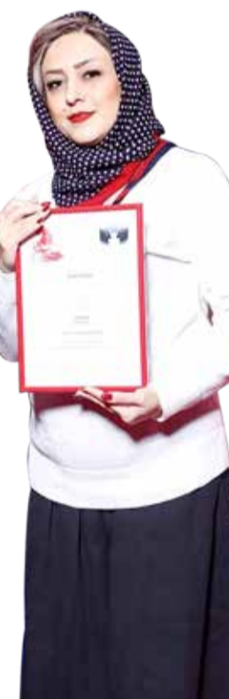
سینماگر از هر دولت یا سازمانی که مشغول کار است، هیچ نمی‌خواهد جز بودجه درست و مناسب و آزادی بیان و اندیشه.

کوتاه بسیار عمیق‌تر شده است. همه مطالعه‌گر و مشاهده‌گرهای خوبی شدند و ما هم فیلمسازهای خلاق و روایت‌کننده‌های خوبی در اشل فیلم کوتاه پیدا کردیم چرا که زمان کم داستان‌گویی خلاقیت بیشتری را می‌طلبد. حجم بالای ارائه آثار باعث آزمون‌ها و خطاهای بسیاری شد و طبیعتاً فیلمسازهای خوب و برجسته‌ای رابه‌بدنه سینما معرفی کردیم. ■ آیا حضور سلبریتی‌ها را در فیلم کوتاه موثر می‌دانید؟ عمدتاً آرزوی مادر گذشته این بود که از سینمای بدنه به ساختار فیلم کوتاه افزودنی‌های مثبتی افزوده شود و اکنون با جدی گرفته شدن فیلم کوتاه این اتفاق افتاد. اگر شخص انتخاب شده درست و به جا انتخاب شده باشد، چه ایرادی دارد که یک سلبریتی باشد کما اینکه به بار فیلم می‌افزاید و فیلم در نظر مخاطب جدی‌تر جلوه می‌کند و شناسخت مخاطب نسبت به بدنه سینمای کوتاه‌نیز بیشتر خواهد شد. ■ به عنوان یک سینماگر از دولت بعدی چه انتظاری دارید؟ چگونه می‌توان سینما را از این حال