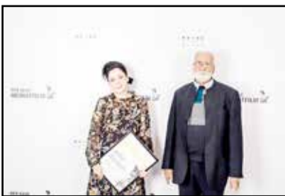
که باعث تامل می‌شود و با پایان‌بندی تاثیر گذارش شما را با نبوه خوانش‌های شخصی تنها می‌گذارد...»

جشنواره درنو هیما فیلم اتریش که از مهم‌ترین جشنواره‌های فیلم در این کشور است هر ساله در شهر تاریخی و قرون وسطایی فریشتاد برگزار می‌شود و میزبان بسیاری از علاقه‌مندان سینما در این شهر تاریخی است. فیلم «قصیده گاو سفید» در نخستین نمایش جهانی خود در بخش مسابقه اصلی هفتاد و یکمین جشنواره فیلم برلین حضور داشت و موفق به کسب جایزه تماشاگران از این جشنواره شد. این فیلم تاکنون در جشنواره‌های معتبر دیگری چون تریبیکا، کارلوویواری، ادینبورو، ملبورن و... به نمایش درآمده است.