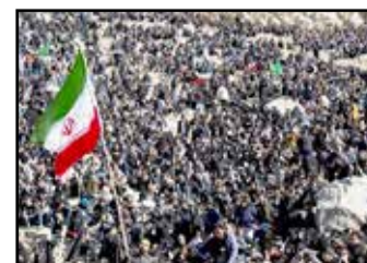
مراسم خاکسپاری سپهبد شهید قاسم سلیمانی

در کرمان، در بازدید و نظارت بر روند درمان مصدومان بستری در بیمارستان‌های کرمان، گفت: متأسفانه در مراسم تشییع سردار رشید اسلام، به دلیل ازدحام جمعیت و مشکلی که در برخی از معابر بود، تعدادی از هموطنان ما که با عشق و علاقه به مراسم آمده بودند، دچار حادثه شدند.